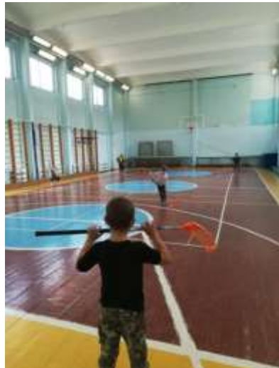
Дети открытой школы Оздоровительного педагогического образования (ООПО) и Внутренней школы качества (ВШ)